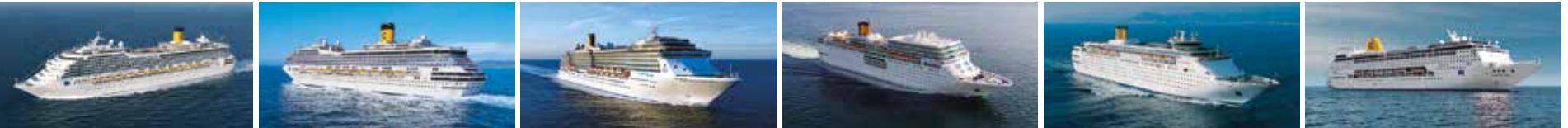
COSTA MAGICA COSTA FORTUNA COSTA MEDITERRANEA COSTA neoROMANTICA COSTA neoCLASSICA COSTA neoRIVIERA